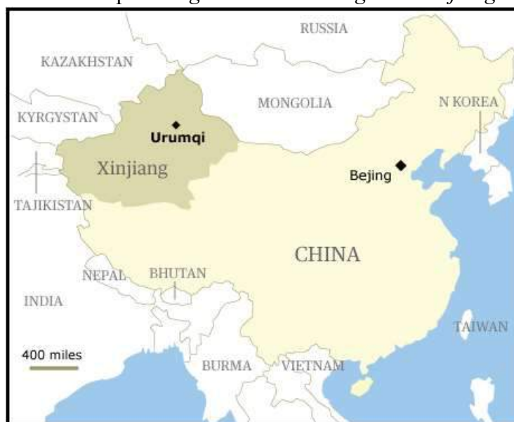
Mapa 1. Región Autónoma Uigur de Xinjiang